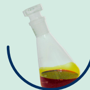
Ferrum sesquichloratum solum D2 Eisen-(III)-chlorid Lösung