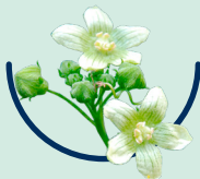
Bryonia D2 Zaunrübe